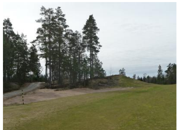
Sten borttagen på hål 2 Kivi poistettu väylällä 2