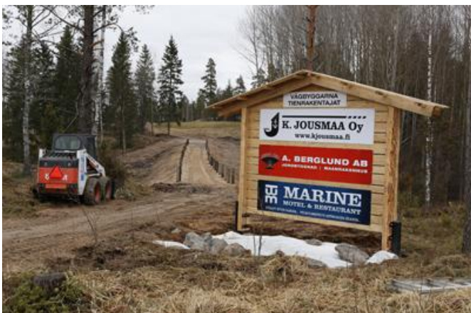
Ny spelarstig mellan hål 4 och 5 Uusi pelaajapolku 4 ja 5 välillä

subjektivinen ja riippuvainen pelaajan HCP:stä, miltä tiiltä pelataan, onko kyseessä mies vai nainen, onko kyseessä vasen- vai oikeakätinen pelaaja jne. Viimeksi kun Stroke Index päivitettiin, käytettiin hyväksi tilastoa, joka oli käytössä väylien rankingjärjestyksen tekemiseksi. Tästä seurasi se, että Stroke Index on melko epätasainen etu- ja takaysin osalta eikä Stroke Index huomioi niitä tekijöitä, jotka mainitaan R&A:ssa.