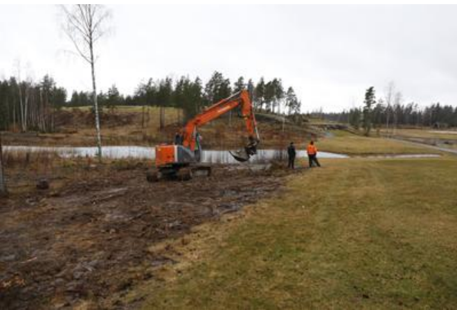
Rensning i skogskanten på hål 4 Metsän raivaus reiällä 4