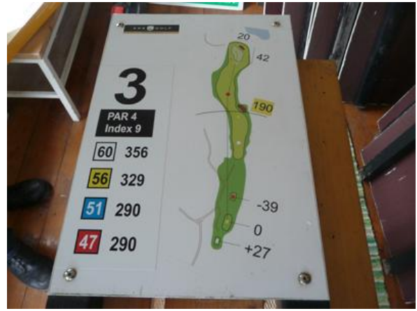
Nya håltavlorna Uudet reikätaulut